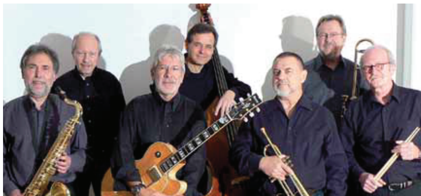
OLD MAN RIVER JAZZBAND